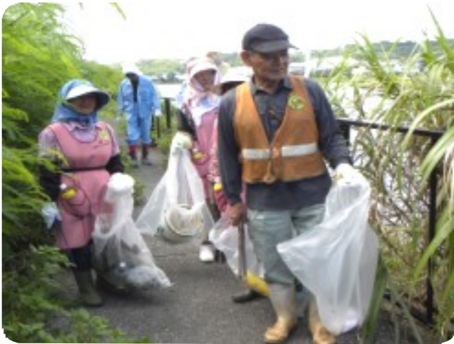
「おきなわマラソン」開催前日、コースになっている同地区内の清掃ボランティアには9人が参加、大会を側面から支援した