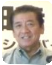
桑江朝千夫 沖縄市長