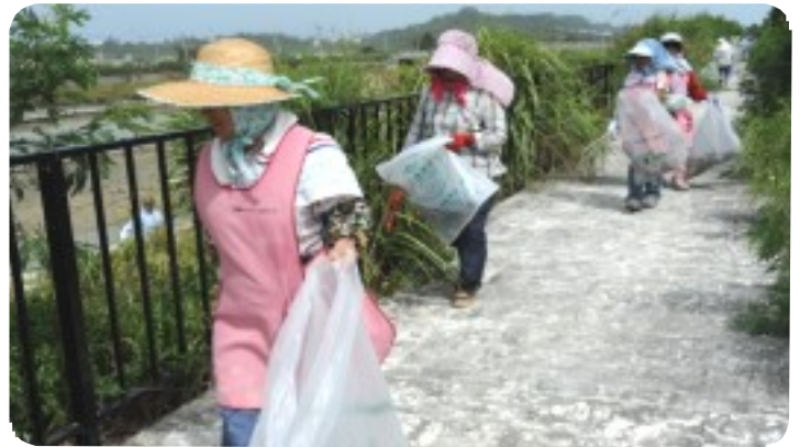
昨年の「海の日ボランティア」には8人が地元企業らとともに参加、ちゅら海を甦らせた