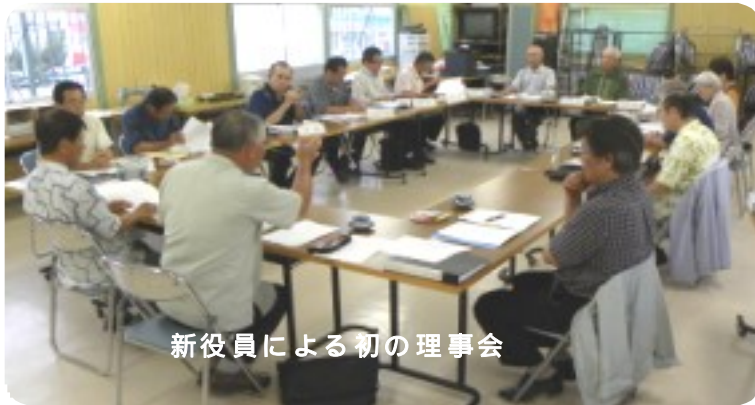
新役員による初の理事会