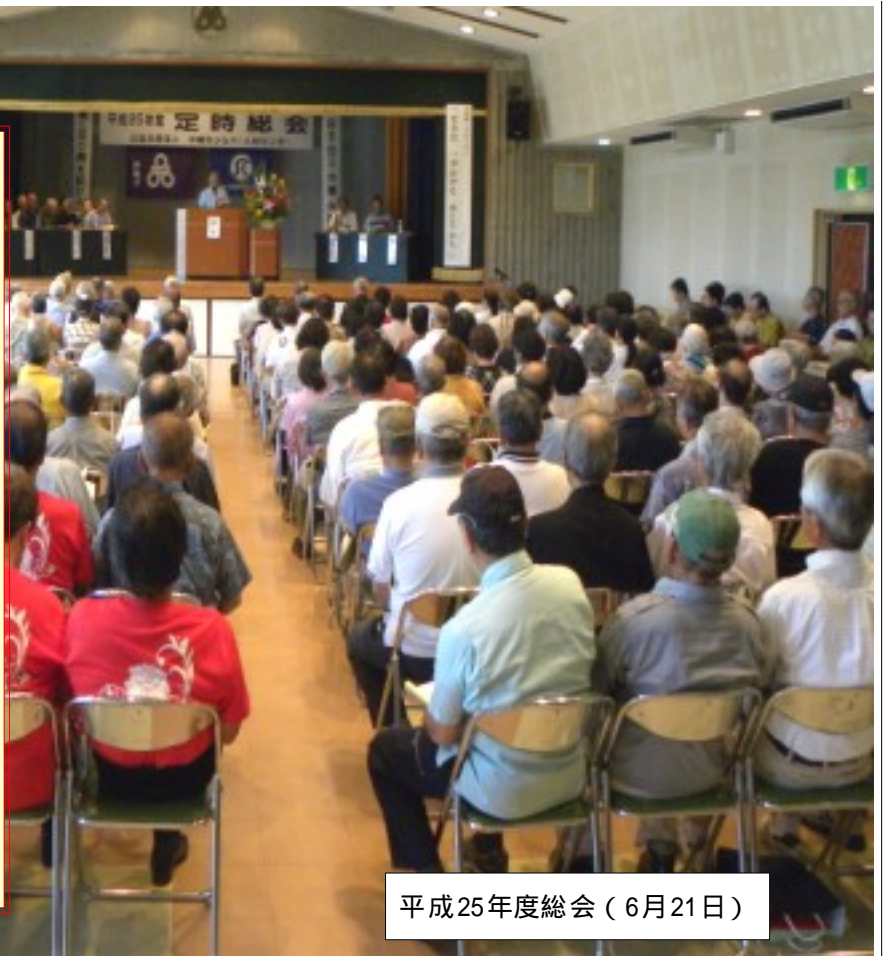
平成25年度総会 ( 6月21日 )