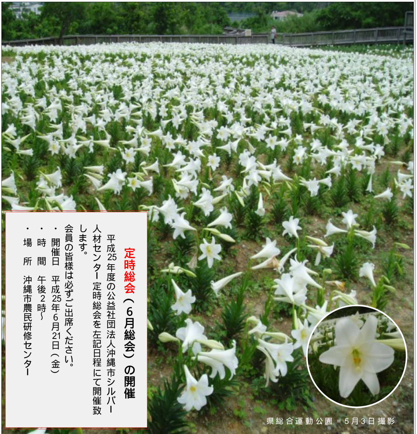
県総合運動公園 = 5月3日撮影