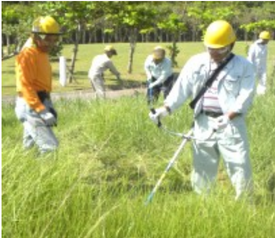
機械操作や安全について学ぶ研修参加者 倉敷ダムにて

参加希望者は11月28日（月）迄事務局 までお申し込みください。 電話での受付は出来ません。