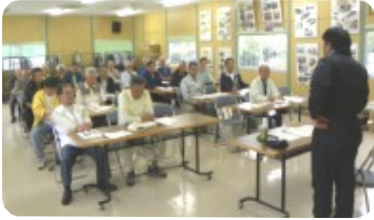
前回の講習会には45人が参加