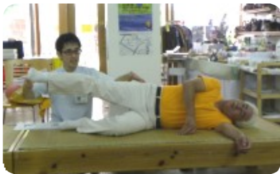
筋トレ = 横上げ体操 横向きに寝て、足を伸ばしたまま床から10センチ上げ5秒間静止。1セット左右各20回