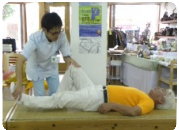
筋トレ「脚上げ体操 あお向けに寝て、片方の膝を立てる。1セット左右20回