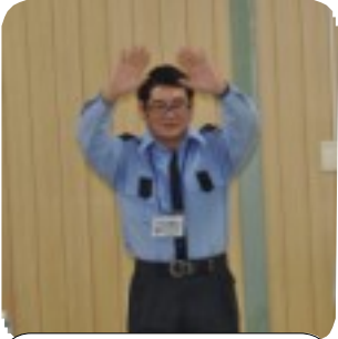
体全体の動きを指導