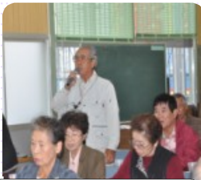
予定時間オーバーもなんのその

事務局職員研修では、「事務局組織と業務分担」又、理事、監事、正副地区長研修では、「これからのシルバー人材センター事業運営について」をテーマに、質問にも分かり易く答えて頂き、大変実りのある研修会でした。(3面に関連)