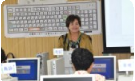
明るい講師に初心者もリラックス

開講は、4月・7月・10月・1月の年4回。現在1月生募集中です。年齢不問。定員は各コース18人。お問い合わせは、センター事務局まで。