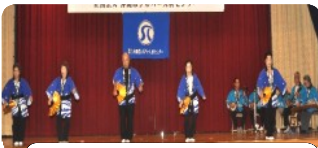
「かぎやで風」センター設立25周年式典にて