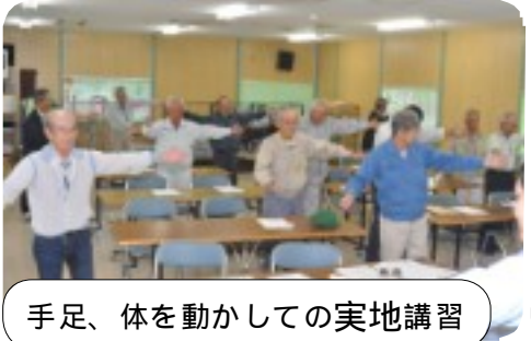
手足、体を動かしての実地講習