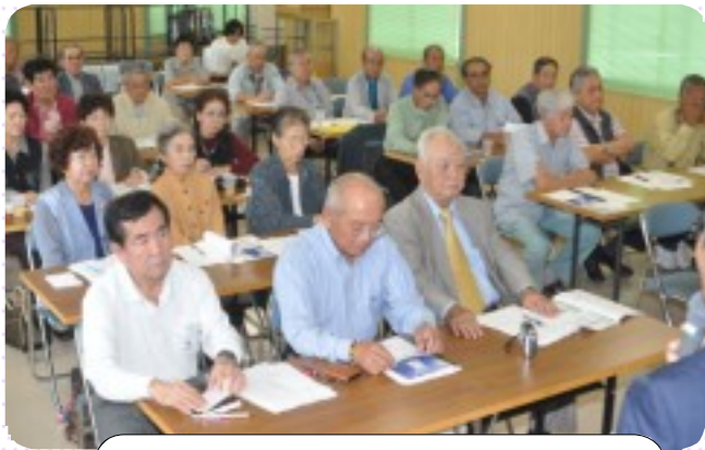
熱心に耳を傾ける理事、監事、正副地区長