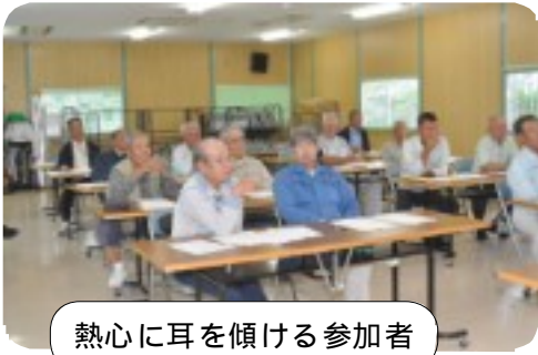
熱心に耳を傾ける参加者