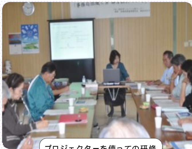
プロジェクターを使っでの研修

プロフィール 短大卒業後、武生市役所勤務、昭和55年(社)福井市シルバー人材センター設立と共に入職、各種委員を歴任、平成16年事務局長、同17年常務理事兼事務局長に就任、現在に至る。