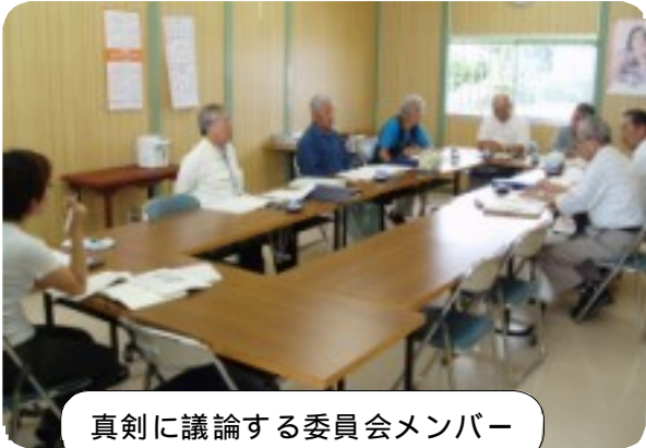
真剣に議論する委員会メンバー