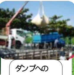
ダンブへの積み込み作業