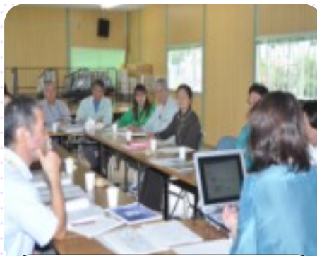
意識改革の話題に真剣な眼差し