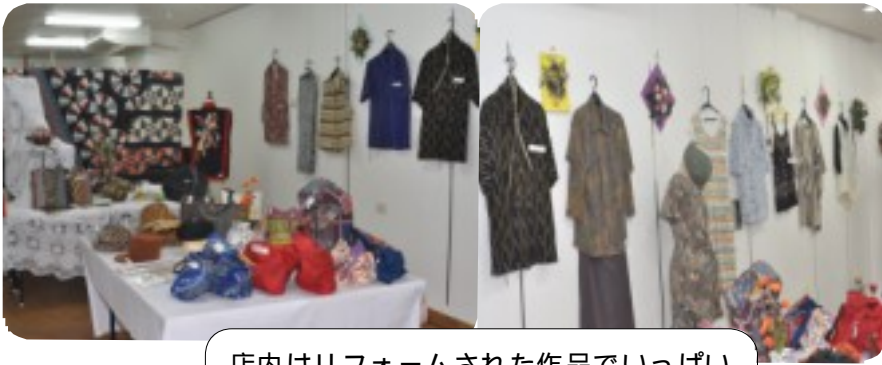
店内はリフォームされた作品でいっぱい

展示会には受講生21人による作品77点が展示され、古い着物などを現代風にリメイクした洋服、バッグ等が、訪れた人の興味を誘っていました。