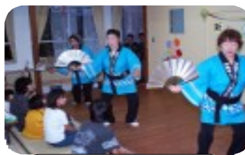
福祉施設慰問先にて

昨年9月に結成された、琉舞同好会メンバーは現在20人を超え、シルバー行事や「いきいきフェア」等で稽古の成果を披露しています。又、結成当時、「ゆくゆくは福祉施設等への慰問も…」と語っていた役員たちの夢も実現、現在では慰問先で舞い、又施設内の草刈り、植栽等のボランティア活動も実施、大変喜ばれ感謝されています。