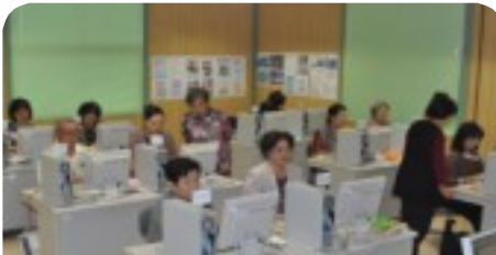
真剣にパソコンと向き合う受講生

初級、中級、上級コースに加え、エクセル、デジカメコースを開設、18台のパソコンに現在89人が受講中です。又、初心者向けにキーボードの練習、予習復習の単発コースも用意されています。モットーは常に親切、丁寧、分かり易い講習で、受講生にも評判は上々。