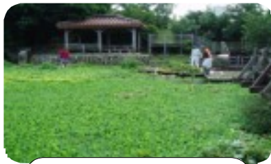
“浮き草”でどこから池？