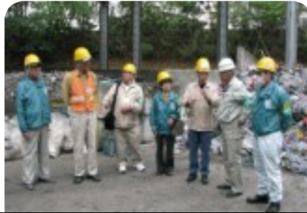
安全就業委員によるパトロール風景

今回は現場で起こった、安全確認、安全確保の欠如から引き起こした事故二例を報告します。