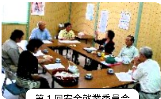
第1回安全就業委員会

又、委員長より「平成二十一年度全国シルバー人材センターにおける重篤事故」について、前年と同件数の53件発生した旨の報告がありました。特に、安全帽・安全帯の未着装による転落・墜落事故(死亡者数14人)が就業中の七割近くを占めており、基本的な安全対策の徹底が求められています。