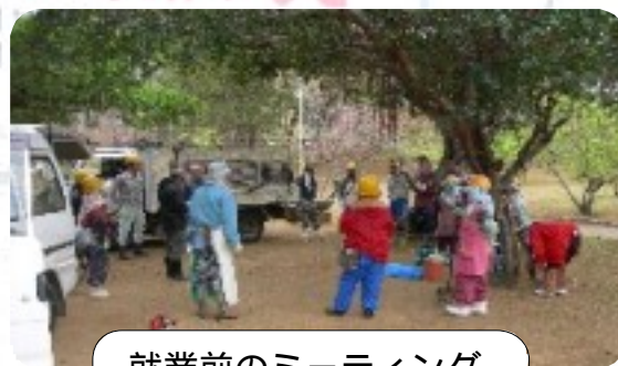
就業前のミーティング