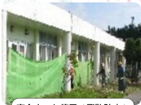
安全ネット使用(飛散防止)