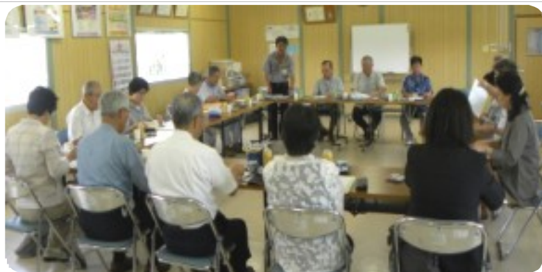
当センターの独自事業について桑江理事長らから話を聞く郡山センターの役職員