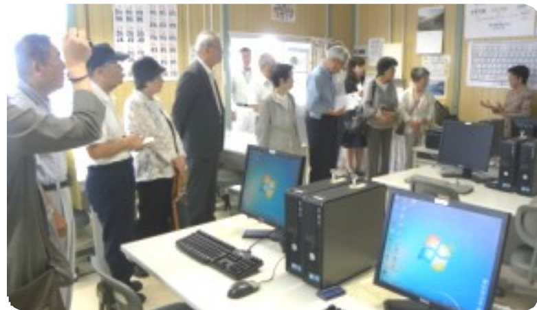
先行する当センターのパソコン教室に熱心に見入り、説明を聞いた